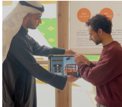
バーレーン若手開発者たちが、バーレーン 館にて「Ship of Time」をインストール する。