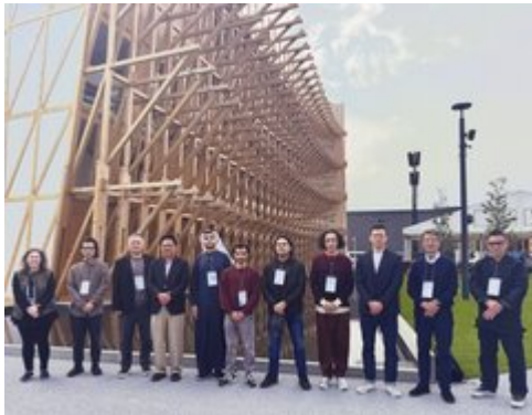
バーレーン万博会場前でのEDBとナツメア タリチーム。